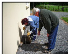
Inspection des regards

Le règlement intérieur sera remis lors de la visite du technicien, celui-ci est également téléchargeable sur le site internet de Villedieu Intercom.