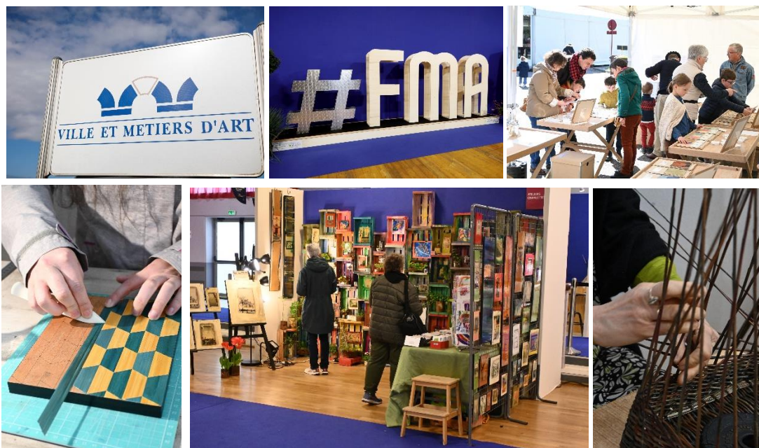
Fête des Métiers d'Art 2024